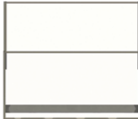
Posição levantada com vidro inferior fosco.