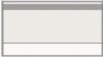
Posição rebaixada com vidro