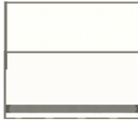
Posição levantada com vidro inferior fosco